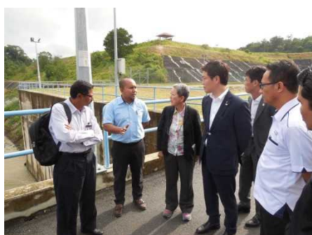
パハン・スランゴール導水トンネル

また、洪水対策と渋滞緩和を兼ねるスマートトンネルを視察したほか、昨年7月に開所した海上交通管制のためのASEAN地域訓練センターを訪れ、VTSシミュレーター等を視察しました。