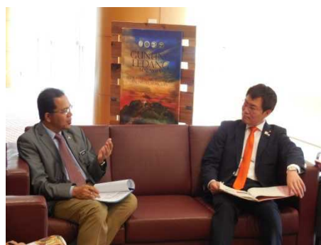
ハミム副大臣との会談