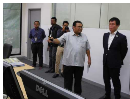
スマートトンネル（コントロールセンター）