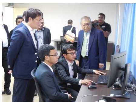
ASEAN 地域訓練センター