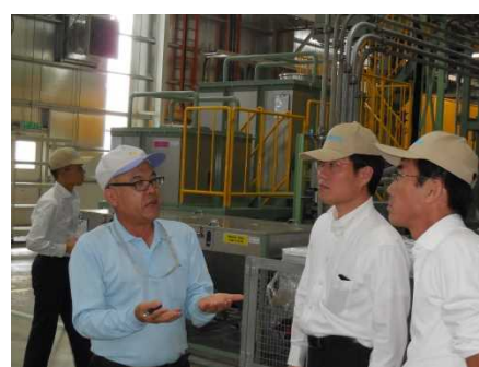
坂本工業マレーシア工場